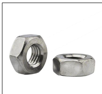
DETALHAMENTO DAS PORCA SEXTAVADA 5/8 " ESCALA 1/50